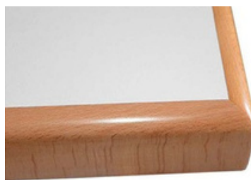
Ecken auf Stoß verleimt

Bitte lesen Sie sich die Gebrauchsanweisung und Sicherheitshinweise sorgfältig durch, bevor Sie das Produkt einsetzen, um Verletzungen und Schäden am Produkt zu vermeiden. Abweichende Nutzung gilt als nicht bestimmungsgemäß und kann zu Sach- und Personenschäden führen. Bewahren Sie die Gebrauchsanweisung während der Nutzung des Produkts auf.