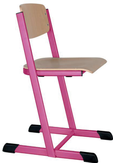
Schulstühle H-Form, offener Sitzträger