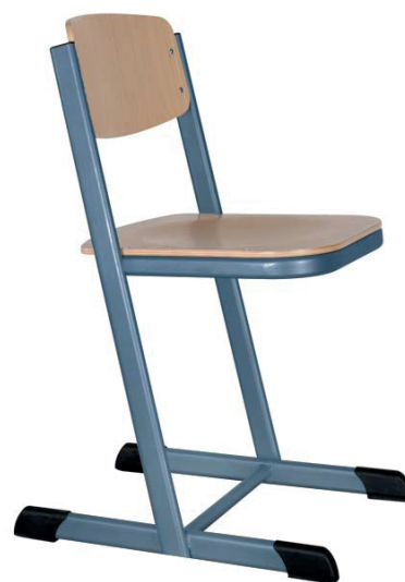
Schulstühle H-Form, geschlossener Sitzträger