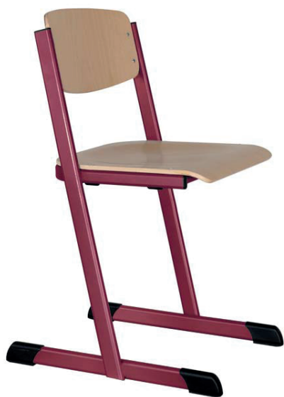
Schulstühle T-Form, offener Sitzträger