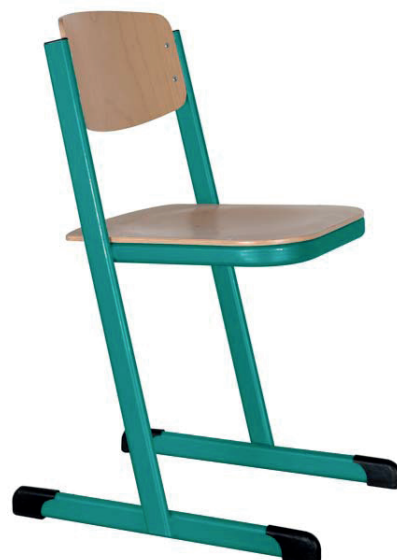
Schulstühle T-Form, geschlossener Sitzträger