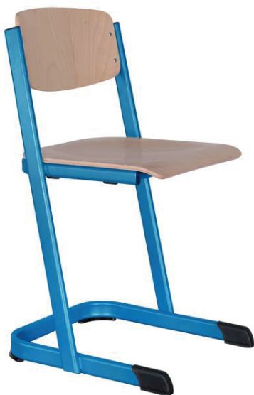
Schulstühle U-Form, offener Sitzträger