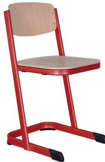
Schulstühle U-Form, geschlossener Sitzträger