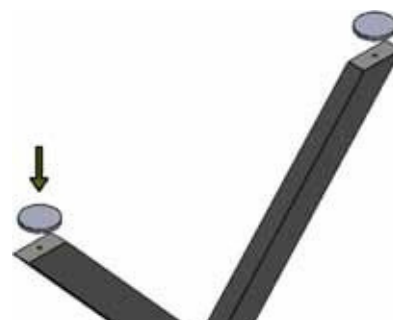
Bodengleiter fertig montiert