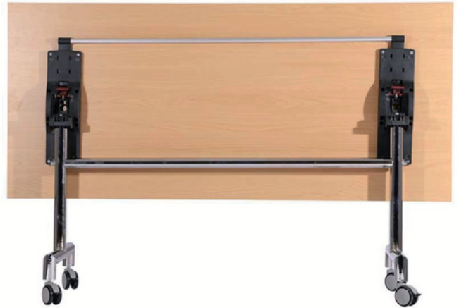
Tischplatte vertikal stehend