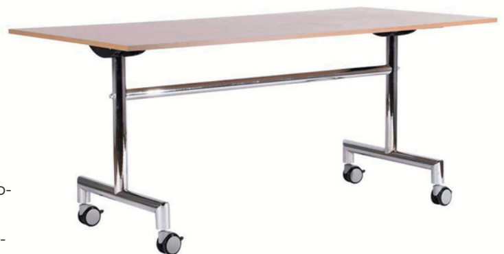
Tischplatte horizontale Stellung