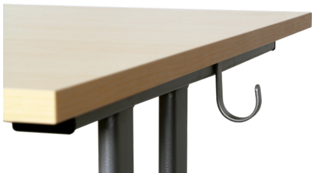
Taschenhaken als Zubehör bestellbar