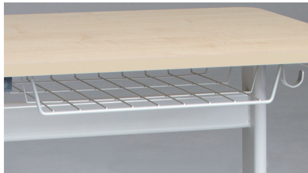
Drahtkorbbablage als Zubehör bestellbar